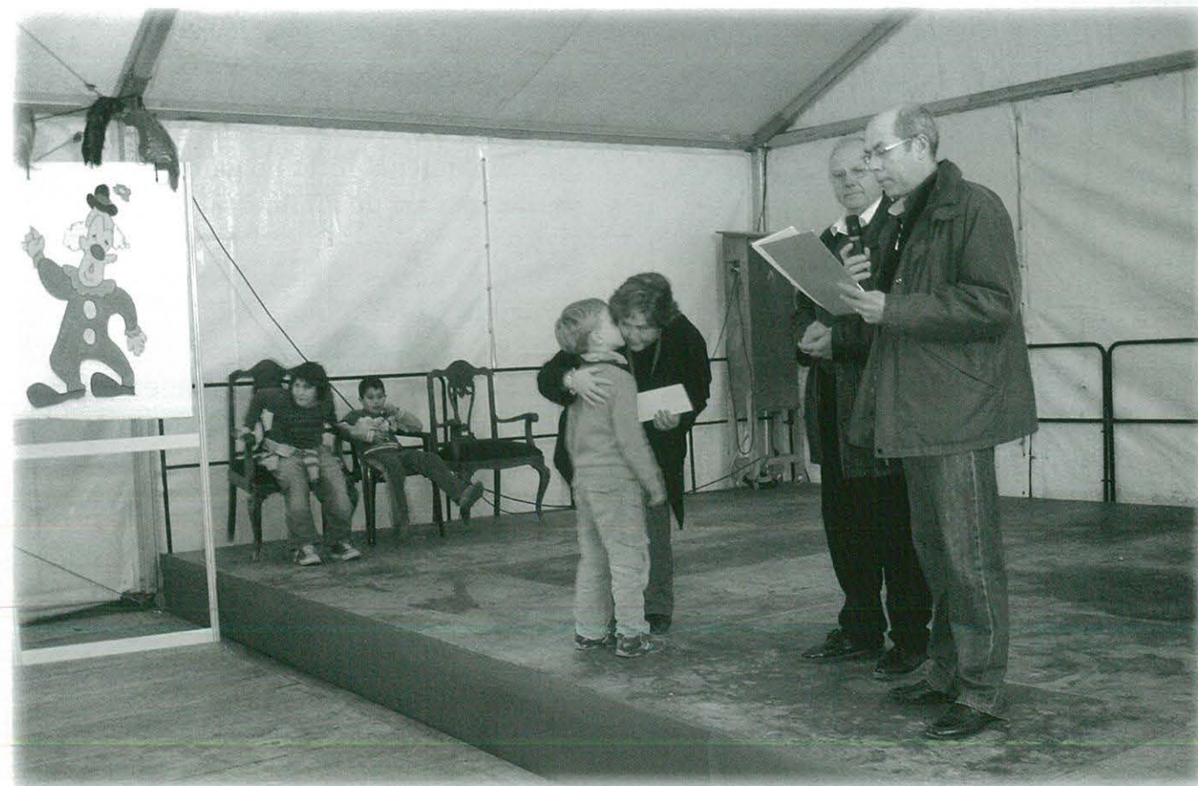
Lliurament de premis del XXXIX Concurs de Pessebres